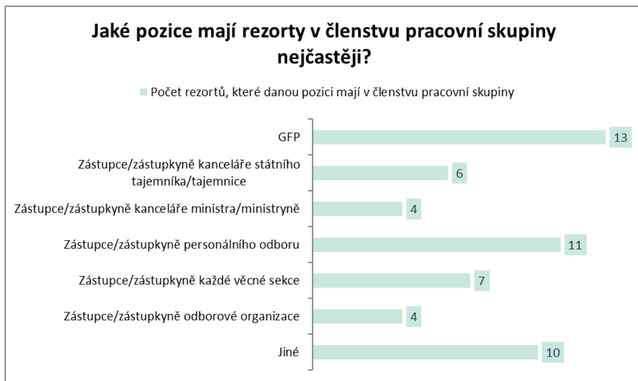
Graf č. 1

Doporučené složení pracovní skupiny dle Standardu pozice GFP 2 nezajistil v roce 2018 ani jeden rezort. Nejbližší doporučenému složení pracovní skupiny byl rezort MMR, kde však chyběl/a zástupce/zástupkyně odborové organizace. V polovině rezortů pak zcela chyběli zástupci/zástupkyně rezortních organizací. Nejdále Standardu pozice GFP bylo v roce 2018 členstvo rezortu MPSV, v němž zasedali pouze zástupci/zástupkyně personálního odboru a každé věcné sekce.