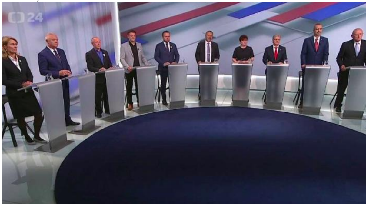
Obrázek 1. Debata zástupců a zástupkyň politických stran a hnutí na téma zemědělství a životní prostředí