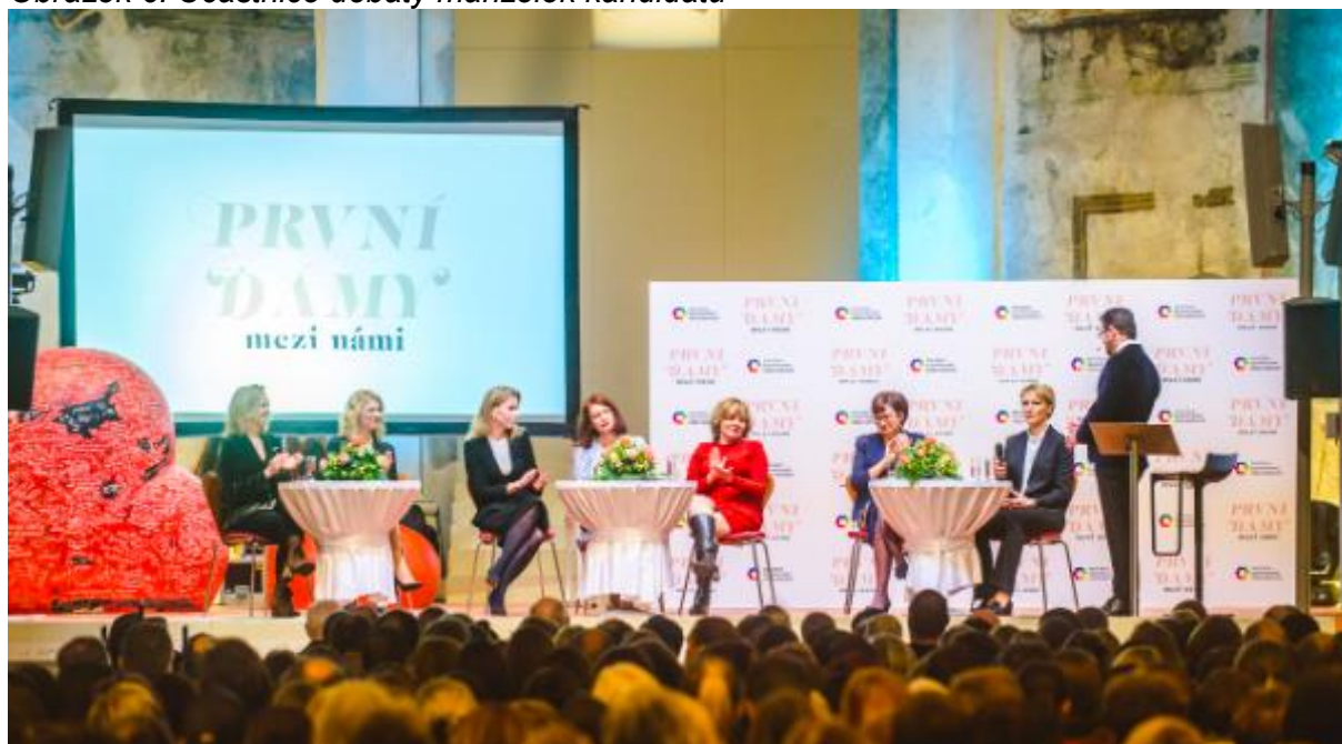
Obrázek 6. Účastnice debaty manželek kandidátů

Vzhledem k absenci žen kandidátek byla nejviditelnějším ženským prvkem v kampani přítomnost manželek jednotlivých kandidátů, které své muže doprovázely v kampani a vystupovaly v médiích. Jediným výrazněji ženským prvkem kampaně byla debata manželek kandidátů, která se konala týden před prvním kolem volby. Tento typ debaty není příliš obvyklý a nemá mnoho vzorů ani v zahraničí. Podobná událost se konala v průběhu kampaně před prezidentskými volbami v USA v říjnu 2007, kdy se pět žen kandidátů na prezidenta USA setkalo v debatě, ve které měly diskutovat o kampaních a své roli v nich (abcnews.com 2007). Takzvané „debaty prvních dam“, kterou organizovala Asociace společenské odpovědnosti, se zúčastnilo sedm žen – manželek nebo partnerek prezidentských kandidátů. 10 Debata nabídla zajímavý vhled do toho, jak si ženy kandidátů představovaly roli první dámy, jaká společenská a politická témata považovaly za důležitá a jak vnímaly postavení žen v české společnosti. 11