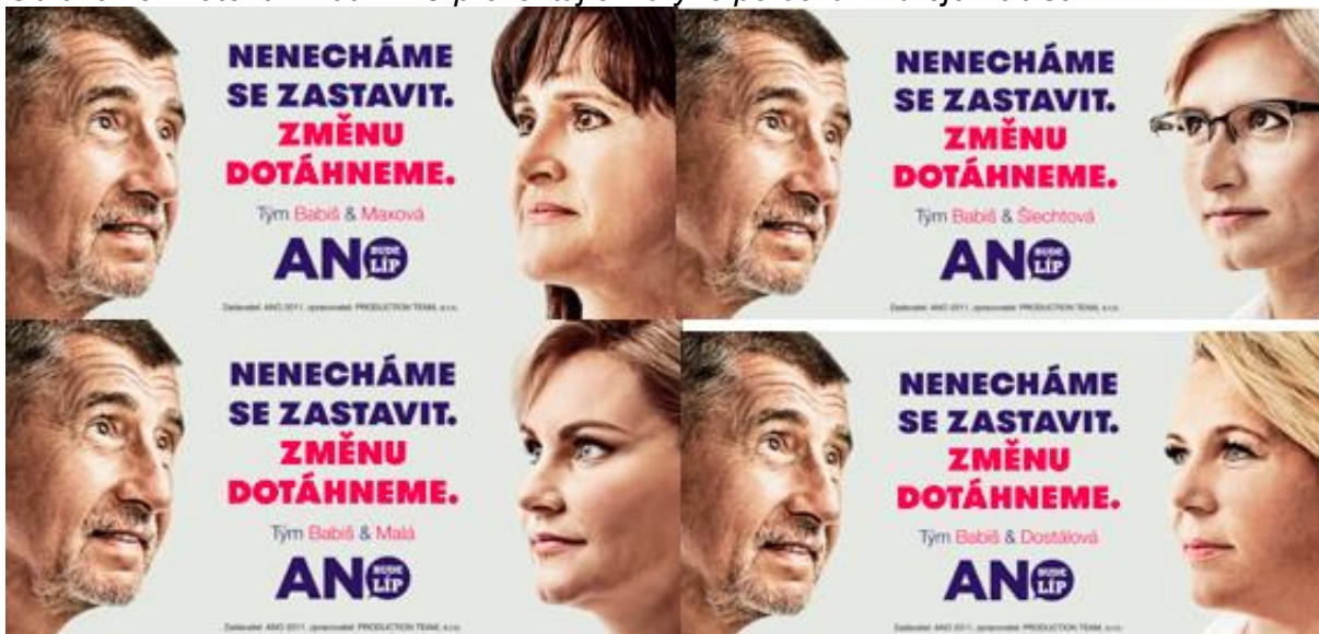
Obrázek 3. Materiál hnutí ANO prezentující lídryně po boku Andreje Babiše

Lídryně krajských kandidátních listin pak byly často zobrazovány po boku předsedů svých stran nebo stranických kolegů a kolegyně. V mnoha případech pak tyto plakáty či billboardy nenesly již žádná vlastní sdělení. Jako ilustrační příklad slouží ANO, které ve svých vizuálních materiálech ve všech krajích prezentovalo místní lídry a lídryně po boku Andreje Babiše. Vizuální materiál byl jednotný pro všechny kraje, prezentoval také stejné stranické volební heslo. Šlo spíše o prezentaci lídrů a lídryň pod hlavičkou stranické značky v doprovodu známého a populárního předsedy, který jednotlivé osobnosti na prvních místech kandidátních listin tímto voličům a voličkám spíše představoval.