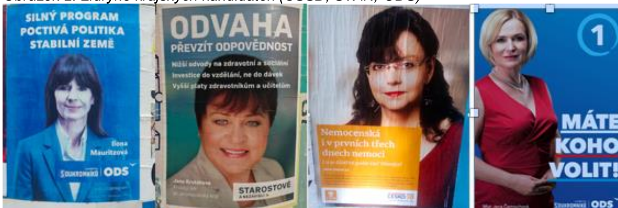
Obrázek 2. Lídryně krajských kandidátek (ČSSD, STAN, ODS)