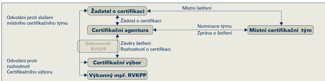
OBRAZEK 1: Účastníci procesu certifikací

Hlavní účastníky procesu certifikací znázorňuje obrázek č. 1: