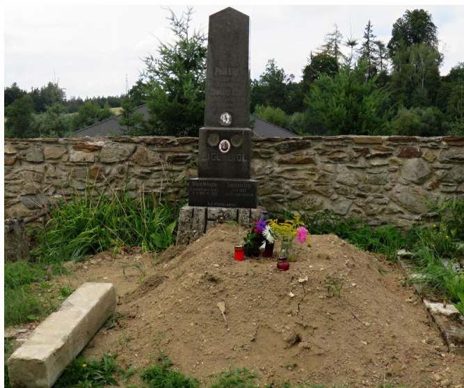
Obr. 6 Čerstvě pohřbený český nebožtík v německém hrobě

Příloha: Německé hroby v Jihomoravském kraji (podklad kraje)