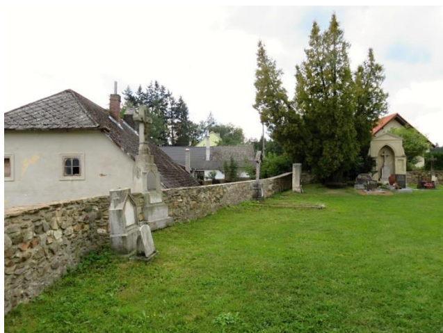
Obr. 5 Německá část hřbitova v Rančářově

Čtvrté jednání proběhlo na hřbitově obce Rančářov. Starosta obce sdělil, že před 13 lety byly německé hroby (až na několik jednotlivých výjimek, které byly alespoň zčásti udržovány) zlikvidovány. Tyto náhrobky jsou v obci uloženy, pro případ, že by o ně jejich majitelé projevíli zájem. Podle informace M. Koláře se tak stalo před 16 lety. Na hřbitově se nachází hromadný „hrob“ německých obyvatel, který je využíván k uložení ostatků/pozůstatků nebožtíků, když se na ně „narazí“ při ukládání nově pohřbívaných. Hřbitov byl ukázkou záměrné plošné devastace, kdy technicistní přístup „zkrášlení“ hřbitova ignoruje otázku piety a závazků k historii místa. Jde přitom o zásahy, na jejichž průběh neměl starosta vliv a nápravu lze po pravdě hledat velmi složitě. Bylo mu navrženo, aby umístil na hřbitov informativní tabuli o Němcích na hřbitově pochovaných (v minulosti obývaly Rančářov pouze tři české rodiny).