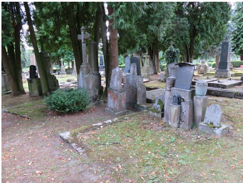
Obr. 4 Německá část hřbitova v Jihlavě

informování o novele zákona o pohřebnictví a všech dalších aktivitách, které v souvislosti s novelou organizuje ministerstvo pro místní rozvoj.