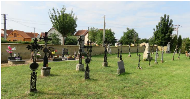
Obr. 1 Chorvatská část hřbitova v Jevišovce