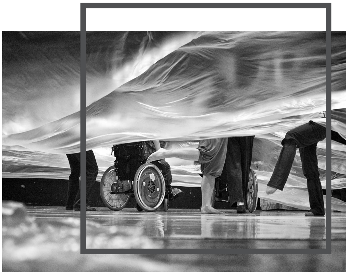
Michaela Bobková - Bílá holubice

„Na plesovou sezónu jsem připravená. Smím prosit?“